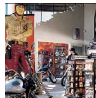
Dat onze mistgenerator t.o.v. de directe concurrentie duidelijk een streepje voor heeft, moge blijken uit bijgaande

afbeeldingen, waar de mistgenerator in diverse interieurs staat afgebeeld. De fraaie vormgeving zorgt ervoor dat het apparaat geen