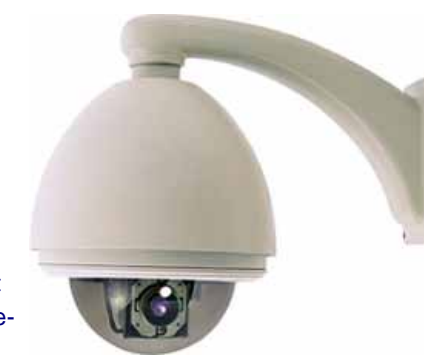
TeleEye speeddome in robuuste, maar elegante buitenbehuizing.

Uitgebreid specificatieblad op onze website.