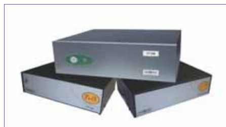
De VT familie video transmissie en opslag systemen

Hiernaast ziet u het huidige uiterlijk van onze VideoSafe producten. Dit is alweer de derde generatie van de reeks video overdracht apparaten van Visual Tools, die