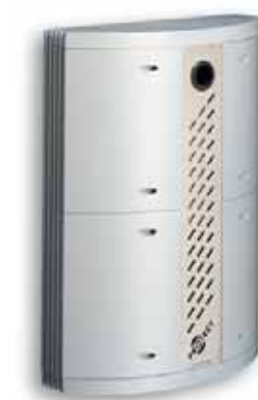
Protect 375 mistgenerator