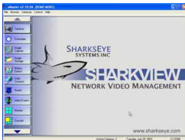
Openingscherm met alle componenten overzichtelijk gerangschikt

dit type camera niet ten goede. AVD introduceert hiervoor een perfecte oplossing: de SharkView Netwerk Video Management Software . Hiermee kunt u een veelheid aan merken en typen IP camera's binnen dezelfde grafische omgeving beheeren, opslaan afspelen en verwerken. Probeerders (30 dagen) zijn op aanvraag verkrijgbaar, zodat u een volledig inzicht krijgt in de uitgebreide mogelijkheden van dit veelomvattende softwarepakket. Dus, als u Axis, Baxall, JVC, Mobotix, TeleEye, Vista en nog veel meer IP producten centraal wilt beheeren, dan is SharkView Netwerk Video Management Software van SharksEye HET antwoord.