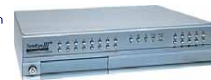
Afgebeeld is de VX-16008 16-kanaals videotransmissie unit met harddiskrecorder, locale bediening en verwisselbare harddisk

heid. De bijgeleverde ontvangstsoftware is Nederlands-talig. Deze software is ook verkrijgbaar in een uitvoering waarbij verbinding kan worden gelegd met 4 locaties tegelijkertijd. De VX serie is voorzien van een modem poort, een extra communicatie poort voor aansluiting van (speed)dome camera's of matrixen, een 10/100 base-T ethernet aansluiting, 4 tot 16 (alarm) ingangen en 4 relais uitgangen. Alle TeleEye VX apparaten zijn triplex, d.w.z. dat u tegelijkertijd kunt observeren, opnemen en afspelen. U kunt er tevens nog twee gewone observatiemonitoren op aansluiten. De gebruikte harddisk is verwisselbaar en van het IDE type. Capaciteits