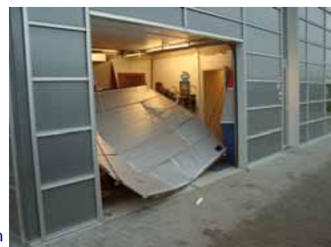
De trieste resultaten ziet u hierboven.

men alleen mee wat direct voor het grijpen lag. Dat daarbij de zichtbelemmering optimaal was, bleek uit het feit dat ook een doos plafondtegels mee werd genomen onder het vermoedelijke motto "zwaar, dus vast wat waard".